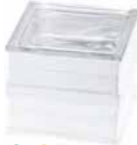
BG 1919/16 90F CLEARVIEW CODE: T078