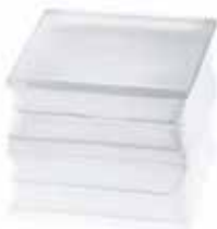
BG 1919/16 60F CLEARVIEW SAHARA 2S* CODE: T077