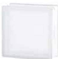
1919/8 BSH20 CLEARVIEW SAHARA 2S* CODE: T004