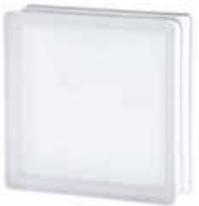
2424/8 CLEARVIEW SAHARA 2S* CODE: T039