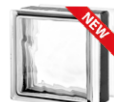
1919/13 120F NUBIO CODE: T029

* Sahara 1 side (sandblasted) available on demand. / Sahara 1 face (sablée) disponible sur demande. / Sahara 1 Seite (sandgestrahlt) auf Anfrage erhältlich. / Sahara 1 lado (satinado a la arena) disponible bajo pedido.