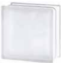
1919/10 30F WAVE SAHARA 2S* CODE: T015