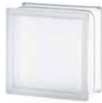
1919/10 30F CLEARVIEW SAHARA 2S* CODE: T013