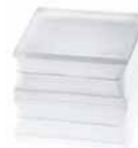
BG 1919/16 90F CLEARVIEW SAHARA 2S* CODE: T079