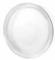
B R19/5 CLEARVIEW SAHARA 1S CODE: C03002