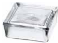
B 1919/7 CIRCLES CODE: T068