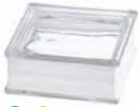
BG 1919/8 30F CLEARVIEW CODE: T074