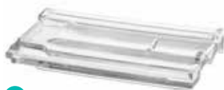
MARSEILLE TILE CODE: T7034

* Sahara 1 side (sandblasted) available on demand. / Sahara 1 face (sablée) disponible sur demande. / Sahara 1 Seite (sandgestrahlt) auf Anfrage erhältlich. / Sahara 1 lado (satinado a la arena) disponible bajo pedido.