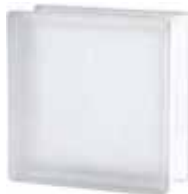
1919/8 BSH20 WAVE SAHARA 2S* CODE: T006