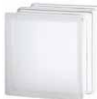
1919/16 90F CLEARVIEW SAHARA 2S* CODE: T021