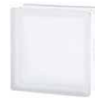
1919/8 30F CLEARVIEW SAHARA 2S* CODE: T017