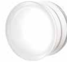
BG R19/10 CLEARVIEW SAHARA 1S CODE: C01002