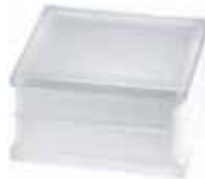
BG 1919/10 CLEARVIEW SAHARA 2S* CODE: T099

* Sahara 1 side (sandblasted) available on demand. / Sahara 1 face (sablée) disponible sur demande. / Sahara 1 Seite (sandgestrahlt) auf Anfrage erhältlich. / Sahara 1 lado (satinado a la arena) disponible bajo pedido.