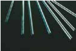
AISI 430 Stainless Steel Rods Barres en acier inoxydable AISI 430 Rundstahl Edelstahl AISI 430 Varillas de acero inoxidable AISI 430