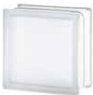
1919/10 CLEARVIEW SAHARA 2S* CODE: T033