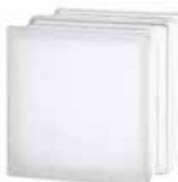
1919/16 60F CLEARVIEW SAHARA 2S* CODE: T019