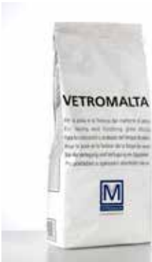
Glass mortar "Vetromalta" White or grey premixed mortar / Vetromalta Il s'agit d'un liant prémélangé de couleur blanche ou grise / Vetromalta Vorgemischter Mörtel in den Farben Weiß oder Grau / Vetromalta Es un mortero premezclado de color blanco o gris