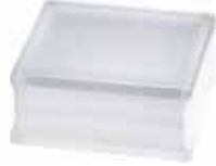
BG 1919/8 30F CLEARVIEW SAHARA 2S* CODE: T075