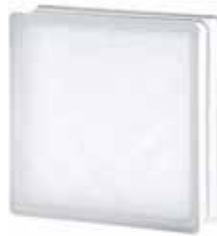
2424/8 WAVE SAHARA 2S* CODE: T042