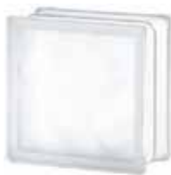
1919/10 WAVE SAHARA 2S* CODE: T035