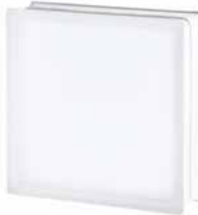
3030/10 CLEARVIEW SAHARA 2S* CODE: T061