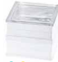
BG 1919/16 60F CLEARVIEW CODE: T076