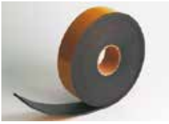
Expansion joint D'expansion joint Dehnungsfuge Junta de dilatación