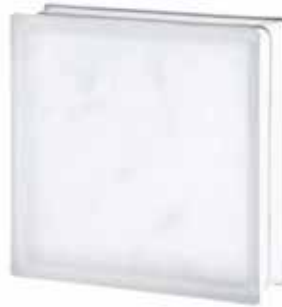
3030/10 WAVE SAHARA 2S* CODE: T060